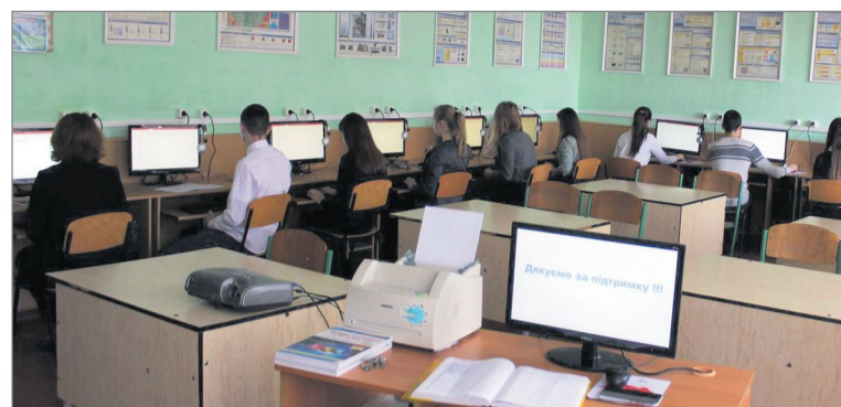
Учнів любомльської гімназії забезпечили комп'ютерним класом