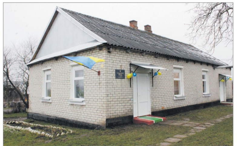
У школу села Рогожани замінили старі вікна на енергозберігаючі

50 тис. грн – придбання музично-звукової апаратури в ЗОШ I-III ст. у с. Галинівка