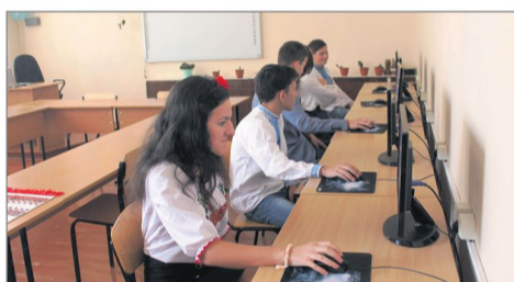
Учням іваничівської школи №2 придбали сучасний комп'ютерний клас