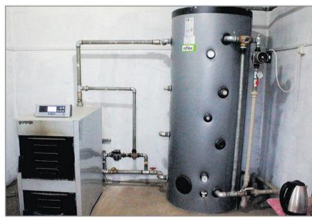
У школі села Микитичі збудували нову котельню та встановили твердопаливний котел

37 тис. грн – встановлення дитячо-спортивного майданчика в селі Маркелівка