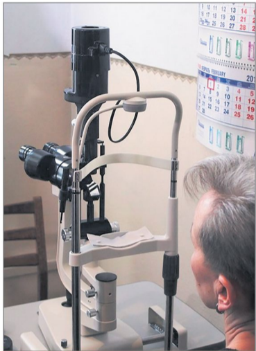
Для Володимир-Волинського ТМО придбали обладнання для діагностики зору

1 млн грн – капремонт басейну ЗОШ I-III ст. №5 ім. Анатолія Кореневського