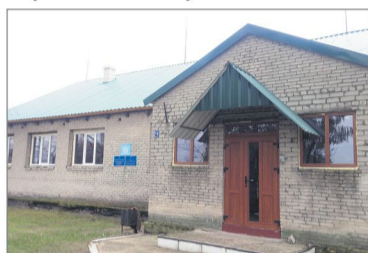
У селі Бережці оновили клуб