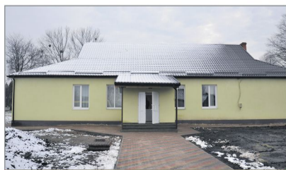
Сільський клуб в Переславичах капітально відремонтували