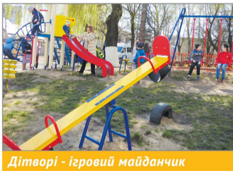
Дітвори - ігровий майданчик

50 тис. грн – придбання обладнання для дитячого майданчика у школі №1