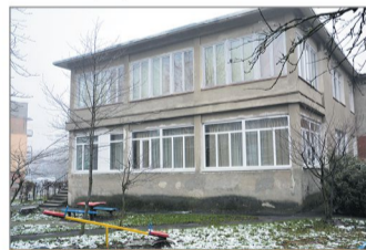
У ДНЗ №2 встановили частину теплих вікон