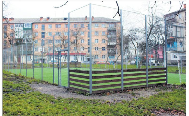
На вулиці Ковельській у місті збудували міні-стадіон зі штучним покриттям

По 40 тис. грн (вартість кожного) – встановлення 5-ти дитячо-спортивних майданчиків