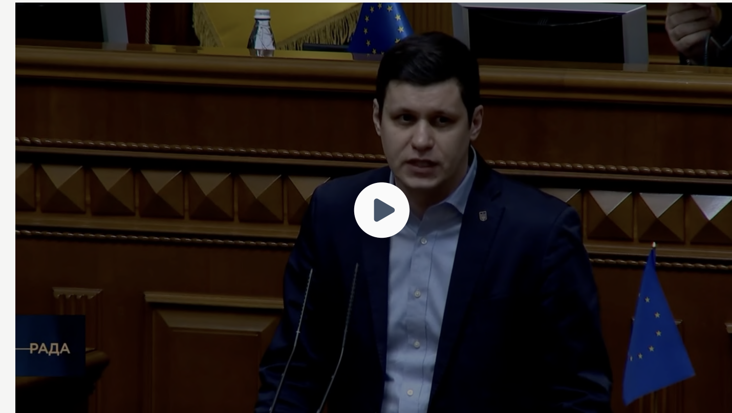
Про зміну підходу до навчання