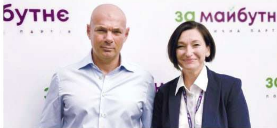
Народні депутати Ігор Палиця та Ірина Констанкевич

КОНСТАНКЕВИЧ ІРИНА МИРОСЛАВІВНА – народний депутат України VIII та IX скликань.