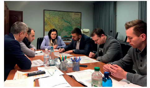
Зустріч з головою Державного агентства автомобільних доріг України Александром Кубраковим.