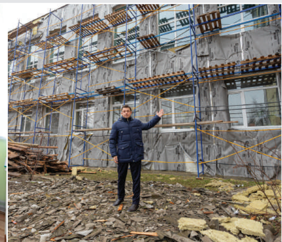
Власівська ЗОШ I-III ступенів №8