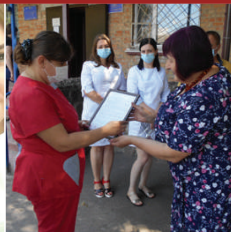
День медичного працівника