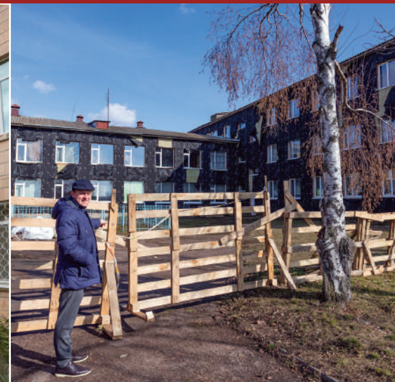
Олександрівське НВО №1