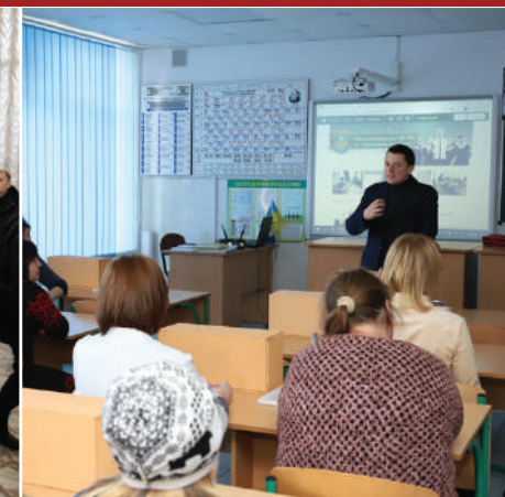
Олександрівське НВО №2