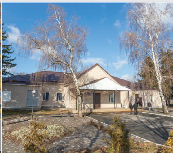
Будинок культури смт Знам'янка Друга