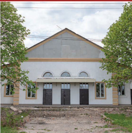
Будинок культури «Іскра» смт Олександрівка