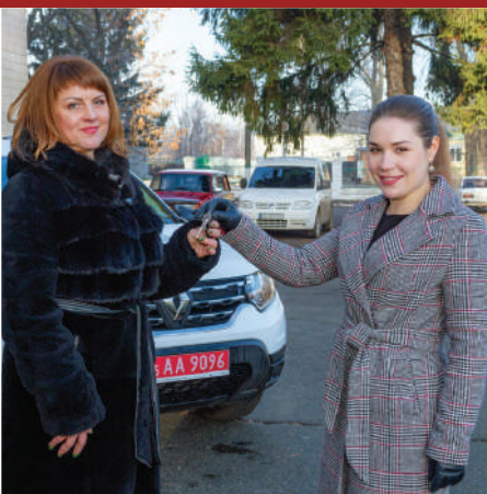
Передача нової машини для фельдшера