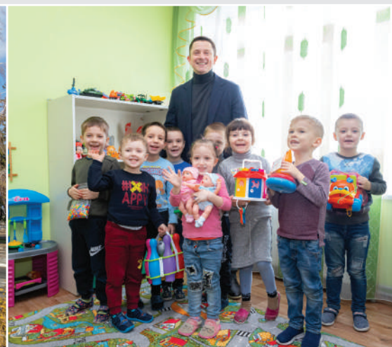
ДНЗ «Барвінок» с. Мошорине Знам'янського району