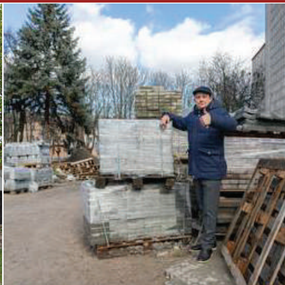
Реконструкція площі Героїв Майдану в м. Знам'янка