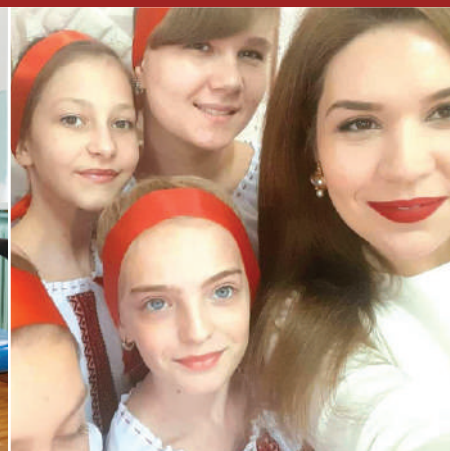
Свято 8 Березня