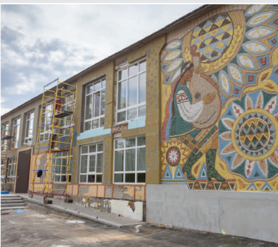
Онуфріївський районний Будинок культури