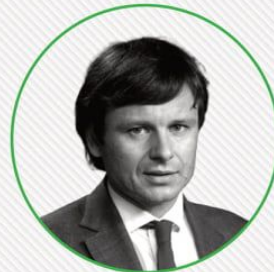
МАРЧЕНКО С.М. (МІНІСТР ФІНАНСІВ)