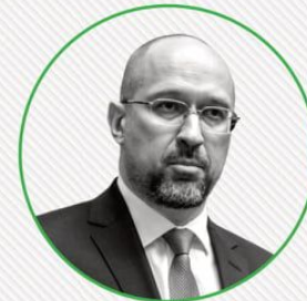
ШМИГАЛЬ Д. А. (ПРЕМ'ЄР-МІНІСТР УКРАЇНИ)