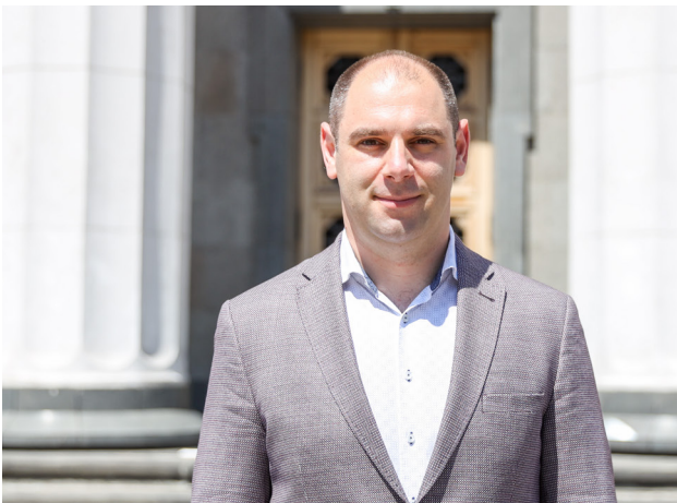
Звіт народного депутата України Дмитра Кисилевського