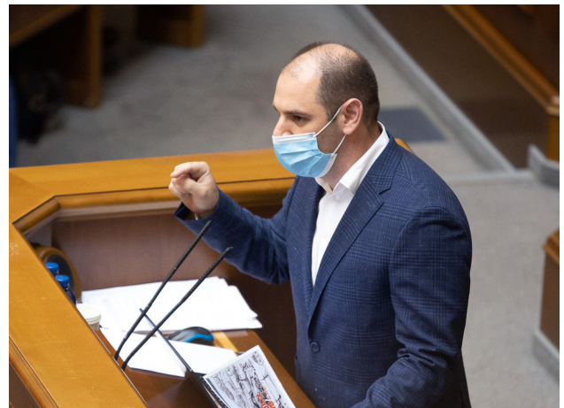
Виборчий округ №24