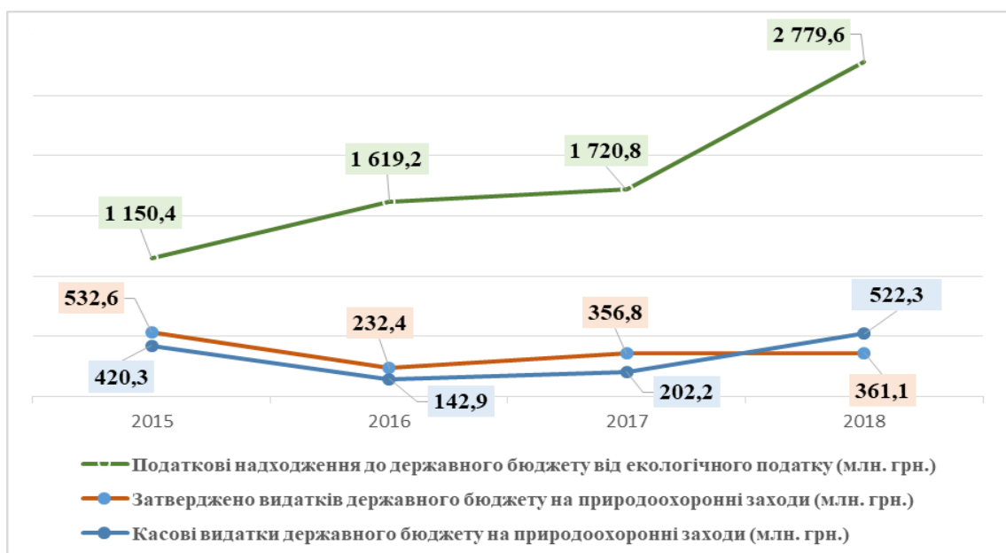
Рис.2. Динаміка надходжень та видатків екологічного податку на природоохоронні заходи з Державного бюджету України

Окрім цього, треба зауважити, що на підставі аналізу динаміки надходжень від екологічного податку та видатків на природоохоронні заходи з Державного бюджету України за 2015-2018 рр., можна зробити висновок про те, що надходження від екологічного податку значно перевищують витрати бюджету на цільові природоохоронні заходи, що має ознаки неефективного та нецільового використання екологічного податку і є порушенням Закону України "Про охорону навколишнього природного середовища".