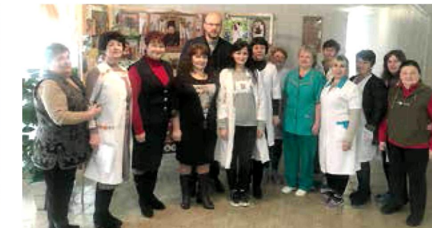
3 грудня. Сміла. У Міжнародний день людей з інвалідністю відвідав Смілянський психоневрологічний інтернат