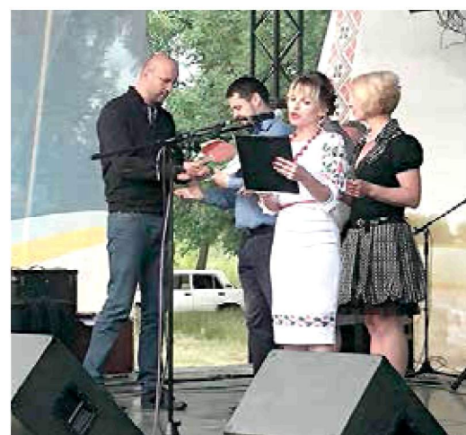
24 червня – Нижній парк Сміли. Найкращі юнаки та дівчата отримали від мене спецпризи до Дня молоді