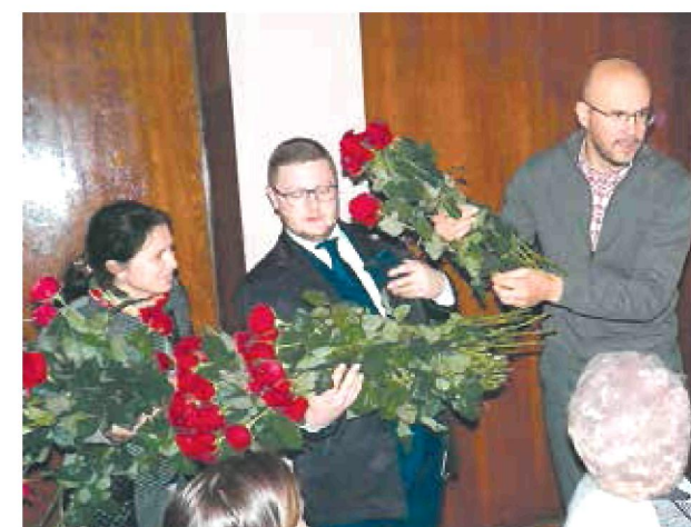
3 жовтня. Сміла. Традиційна троянда кожній жінці-педагогу Сміли до Дня працівника освіти