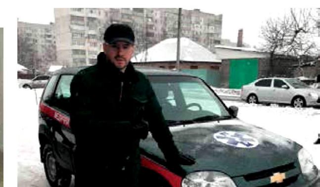
22 грудня. Сміла. Центр первинної медико-санітарної допомоги отримав довгоочікуваний санітарний автомобіль