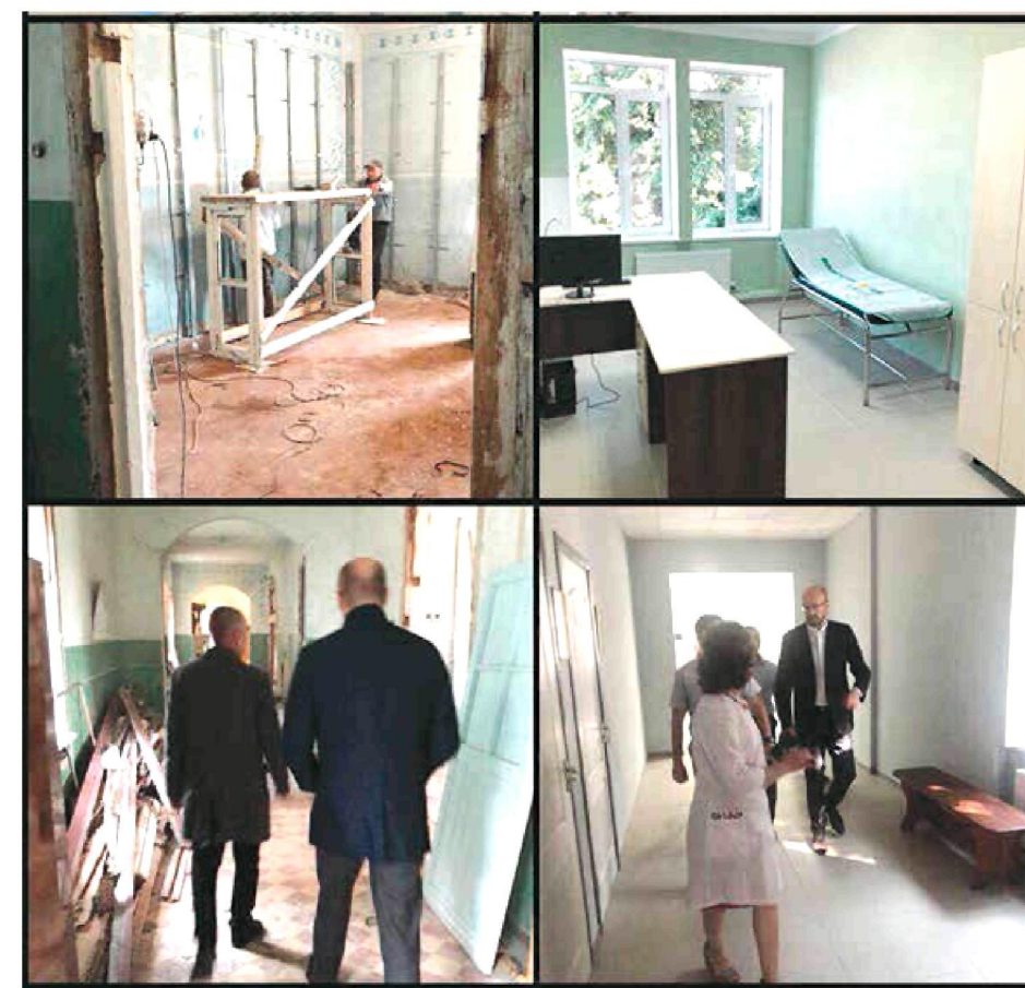
12 липня. Сміла. Центральна районна лікарня ім. С. Бобринської. Інспектуємо хід завершення робіт у поліклінічному відділенні. На фото: до / після ремонту