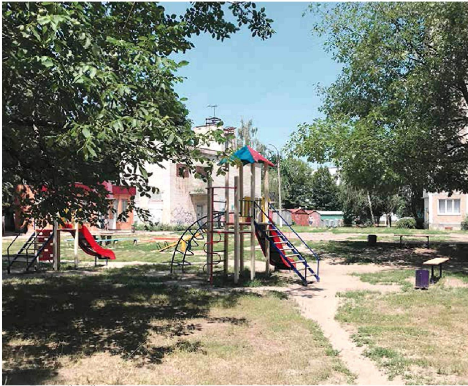
Дитячий майданчик по вул. Лобачевського у Смілі