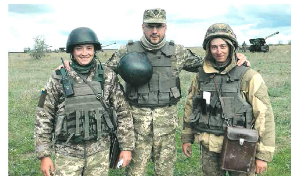
27 вересня. Миколаївська область. Полігон «Широкий лан». Із побратимами під час проходження воєнної перепідготовки