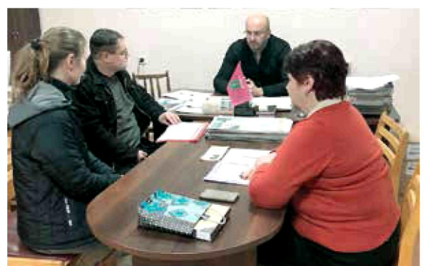
5 січня. Сміла. Перший у 2018 році особистий прийом громадян у моїй громадській приймальні

Кінець року – своєрідний момент істини, коли кожен із нас підбиває підсумки, замислюється над тим, чого вдалося досягти і чого ми ще прагнемо. 2018 рік був досить складним і насиченим подіями. Протягом цього року тільки у Смілі був щонайменше 40 разів. Пропоную Вашій увазі фото, які вдалося вмістити на шпальту.