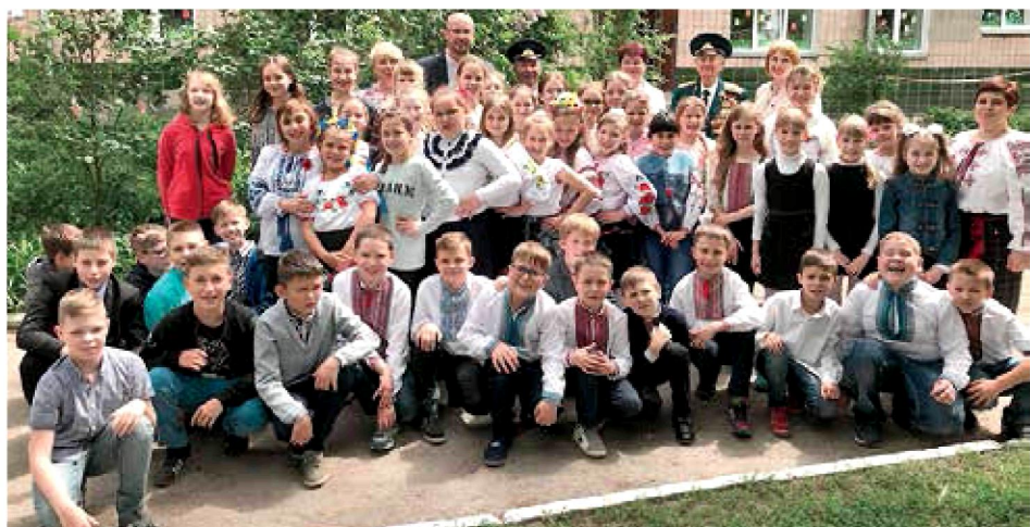
8 травня. Сміла. День пам'яті та примирення. Разом із учнями смілянських шкіл після зустрічі з ветеранами Другої світової