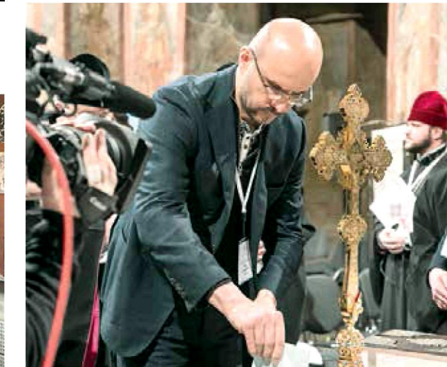
15 грудня. Софія Київська. Об'єднавчий собор. Мій голос «за» Православну церкву України