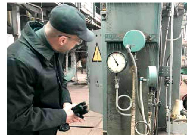
18 листопада. Сміла. Під час запуску найбільшої в місті котельні № 25