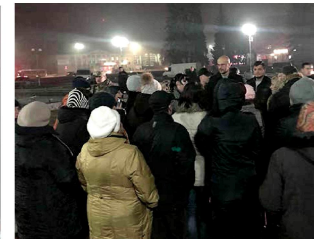
9 листопада. Сміла. Разом із небайдужими смілянами беру участь у віче стосовно відсутності в місті теплопостачання