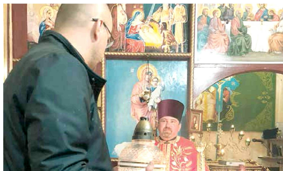
8 квітня. Сміла. Капличка Преподобної мучениці Євгенії УПЦ КП. Особисто завіз Єрусалимський благодатний вогонь в українські церкви свого округу