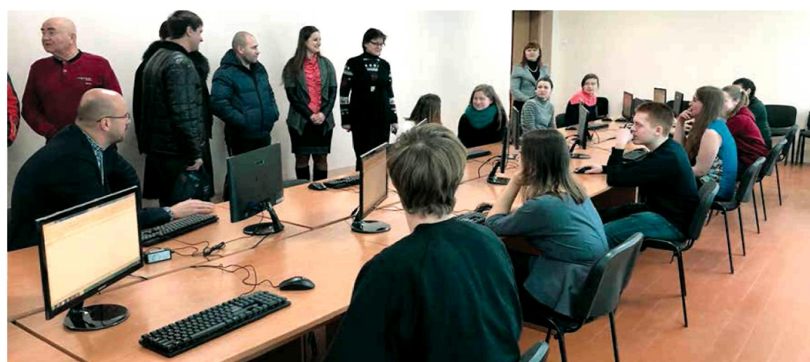
23 лютого. Сміла. Урочисто відкрили новий комп'ютерний клас для студентів Центру підготовки та перепідготовки робітничих кадрів