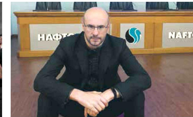
14 листопада. Київ. Боротьба за тепло у Смілі триває!