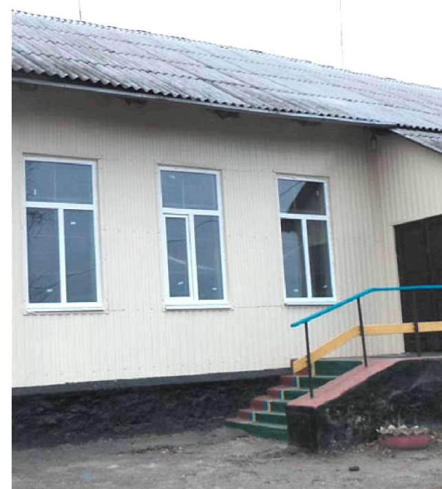
Здійснили заміну вікон у Балаклеївській загальноосвітній школі I-II ступенів № 2.