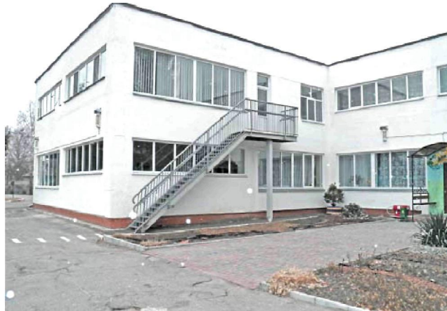
Замінили віконні блоки у дошкільному навчальному закладі № 23 "Чиполіно" по вул. Мічуріна, 42 у Смілі.

Загалом у 2016 році за підтримки народного депутата України Сергія Рудика у Смілі та Смілянському районі було виконано роботи на 84 об'єктах на загальну суму 11 млн 23 тис. грн, у тому числі замінено 311 вікон у 29 школах, 11 дитячих садочках, 4 ФАПх, придбано обладнання для центральної райлікарні ім. С. Бобринської (із повним переліком об'єктів можна ознайомитися на стор. 3) Пропоную Вашій увазі короткий фотозвіт проведених робіт (те, що вдалося вмістити на шпальту)