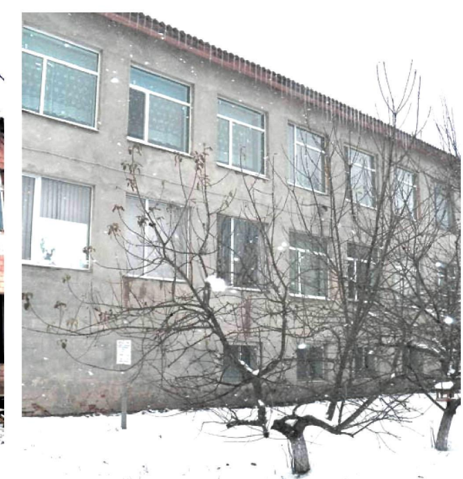
Замінили вікна у Великояблунівській загальноосвітній школі I-III ступенів.