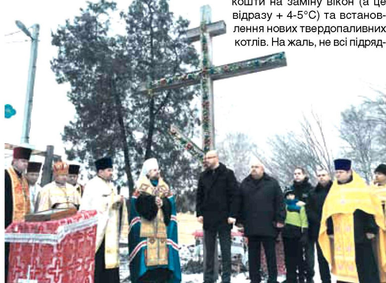
25 грудня 2016 року – під час освячення фундаменту та закладання

Із благословення Його Святості Патріарха Філарета опікуюся не тільки смілянською церквою. Також допомагаю Свято-Покровській церкві та церкві Петра і Павла у Кам'янці. У Дубіївці, що в Черкаському районі, допомагав у встановленні купола у Свято-Миколаївській церкві. Допоміг церкві Святої Софії Премудрості Божої у Леськах та церкві Великомученика Дмитрія Солунського у Пастирському на Смілянщині. А нещодавно долучився до започаткування будівництва церкви Покрови Пресвятої Богородиці у Білозір'ї. Користуючись нагодою, звертаюся до всіх небайдужих із проханням долучитися до цієї благодатної справи.