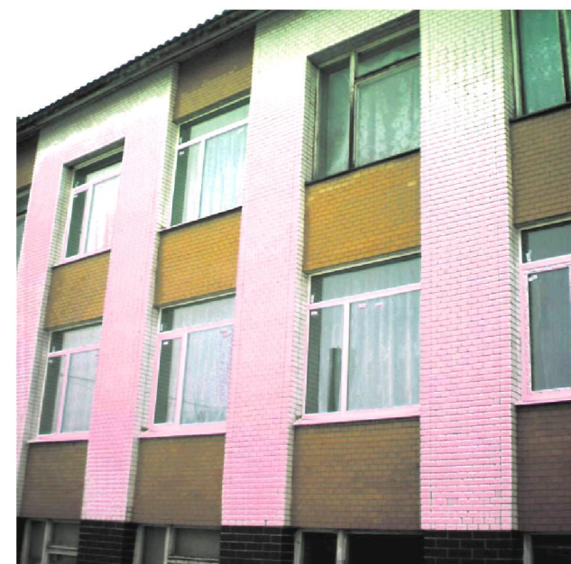
Замінили вікна у Мельниківській загальноосвітній школі I-II ступенів.