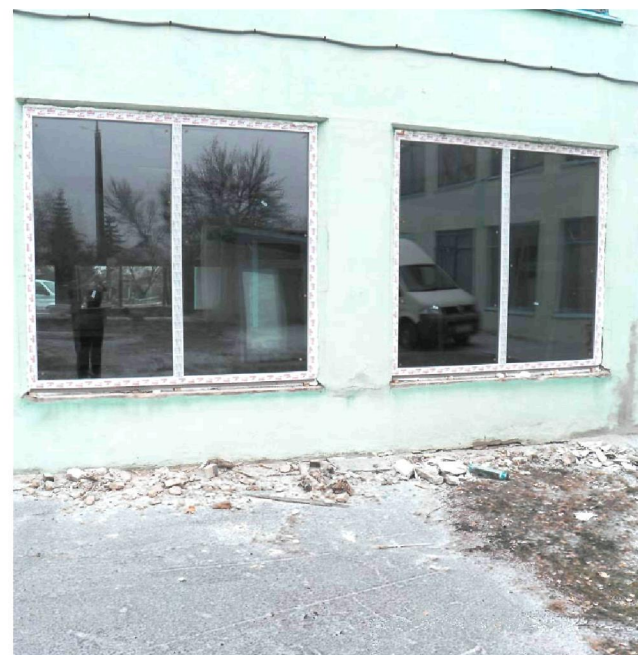
Замінили віконні блоки у Центрі соціальної реабілітації дітей-інвалідів "Барвінок" по вул. Філатова, 8-а у Смілі.