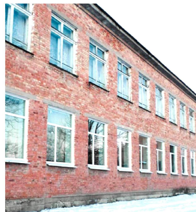
Замінили вікна у Пастирській загальноосвітній школі I-II ступенів.