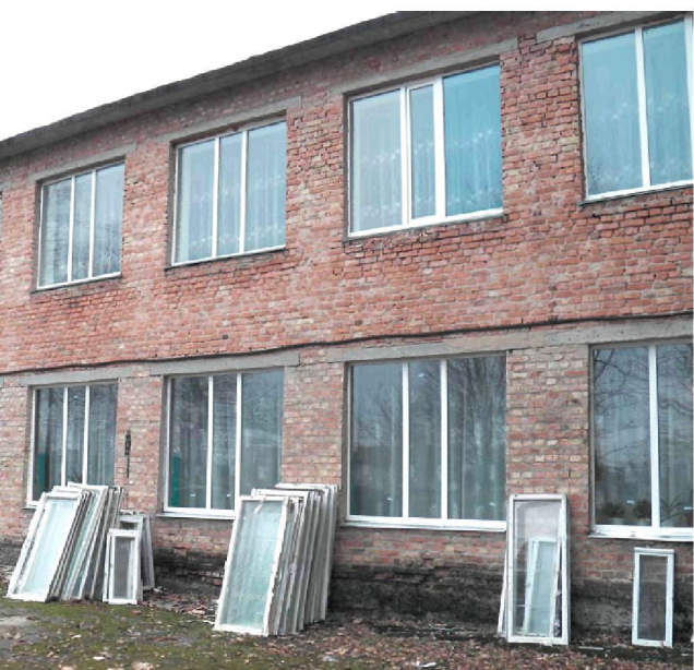
Замінили вікна у Балаклеївській спеціалізованій школі I-III ступенів № 1 імені Є. Гуглі.