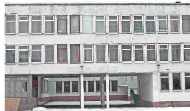
Провели капітальний ремонт будівлі загальноосвітньої школи I-III ступенів № 11 по вул. Репіна, 47 у Смілі.