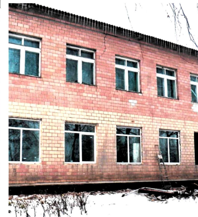
Здійснили капітальний ремонт по заміні віконних блоків Березняківської загальноосвітньої школи I-III ступенів.