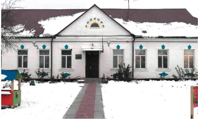
Відремонтували покрівлю ДНЗ "Сонечко" у селі Будки.