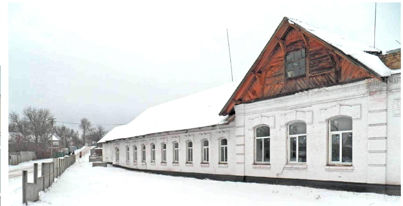
Замінили вікна у Балаклеївській амбулаторії загальної практики – сімейної медицини.