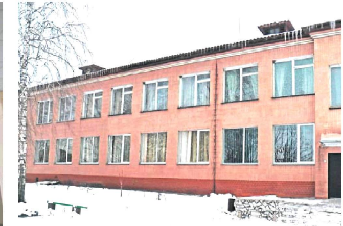
Замінили вікна у Голов'ятинській загальноосвітній школі I-III ступенів.