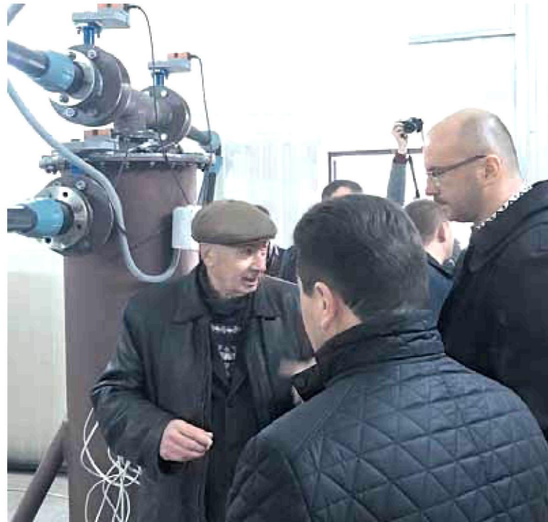
Огляд реконструкції очисних споруд у Кам'янці.

– Я є одним зі співавторів законопроектів, згідно з якими в Україні з'явиться Державний дорожній фонд. Фактично він запрацює з 1 січня 2018 року, а не як планувалося у 2017 році. Депутати прийняли рішення, що потрібно ще рік для того, аби адаптувати дорожню галузь до вільного плавання. Створений фонд поповнюватиметься за рахунок надходжень від суто дорожніх акцизів. Приміром, акцизу з виробленого в Україні та ввезеного на митну територію пального, ввізного мита на нафтопродукти тощо. Починаючи з 2018 року до ДДФ зараховуватиметься 50% усіх цих надходжень, у 2019 – 75% і в 2020 році вже всі 100%. Розподілятимуться ці кошти наступним чином: 60% – на будівництво, реконструкцію, ремонт і утримання автомобільних доріг загального користування державного значення, 35% – у вигляді субвенції з Державного бюджету місцевим бюджетам на будівництво, реконструкцію, ремонт і утримання доріг загального користування місцевого значення. І тут хотів би звернути увагу на одну деталь. У остаточній редакції закону передбачено, що не більше 20% від цієї субвенції може спрямовуватися на будівництво, реконструкцію, ремонт і утримання вулиць і доріг комунальної власності у населених пунктах. Вважаю, що це свого роду прорив у сфері дорожнього будівництва на місцях. Ну і 5% ітимуть на виконання заходів безпеки дорожнього руху відповідно до державних програм.