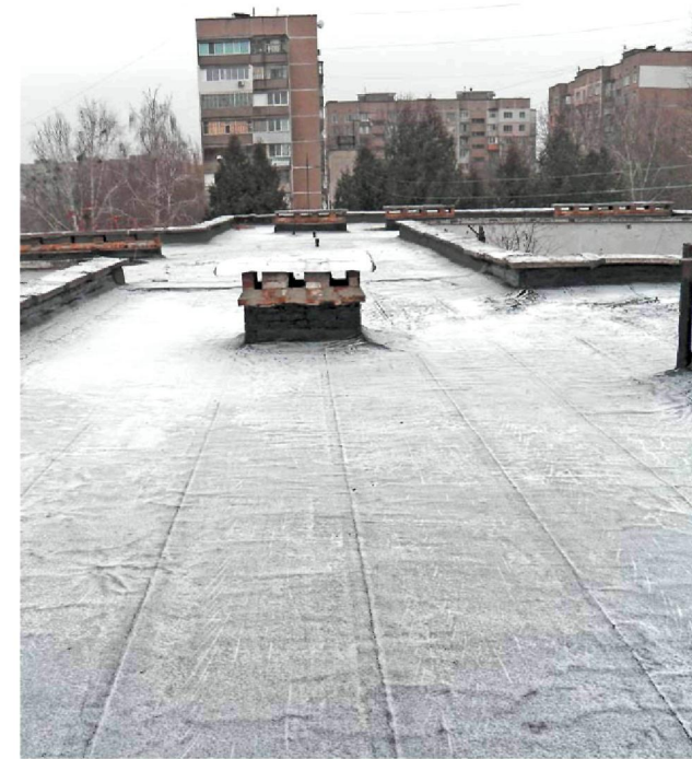
Здійснили капітальний ремонт покрівель будівлі дошкільного навчального закладу № 19 "Світлячок" по вул. Мазура, 23-а у Смілі.