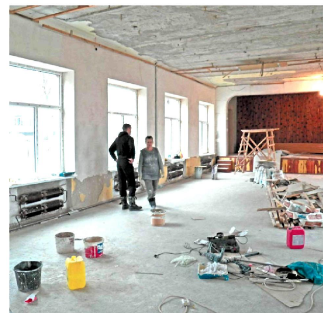
Провели комплексний капітальний ремонт будівлі Смілянської загальноосвітньої школи I-III ступенів № 1 по вул. Незалежності, 66.