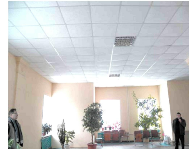
Здійснили капітальний ремонт системи опалення та частини приміщення Будинку культури імені Т. Г. Шевченка по вул. Кременчуцькій у Смілі.