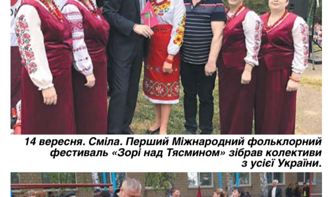
14 вересня. Сміла. Перший Міжнародний фольклорний фестиваль «Зорі над Тясмином» зібрав колективи з усієї України.