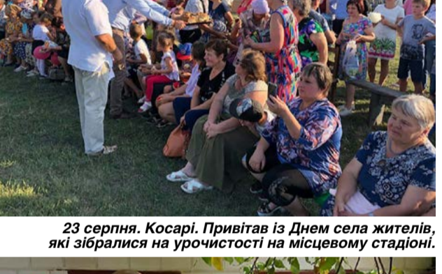
23 серпня. Косарі. Привітав із Днем села жителів, які зібралися на урочистості на місцевому стадіоні.