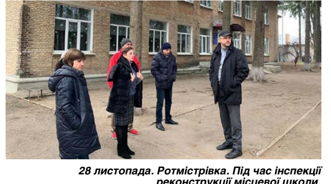
28 листопада. Ротмістрівка. Під час інспекції реконструкції місцевої школи.