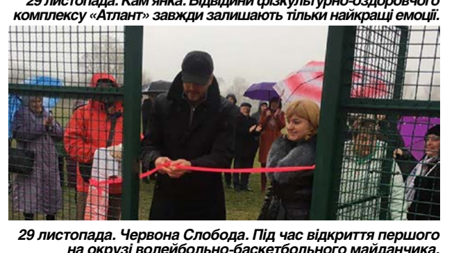
29 листопада. Червона Слобода. Під час відкриття першого на окрузі волейбольно-баскетбольного майданчика.