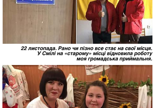
22 листопада. Рано чи пізно все стає на свої місця. У Смілі на «старому» місці відновила роботу моя громадська приймальня.