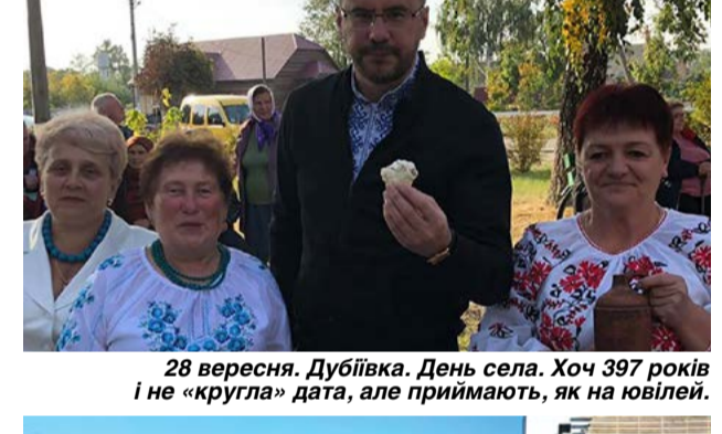
28 вересня. Дубівка. День села. Хоч 397 років і не «кругла» дата, але приймають, як на ювілей.