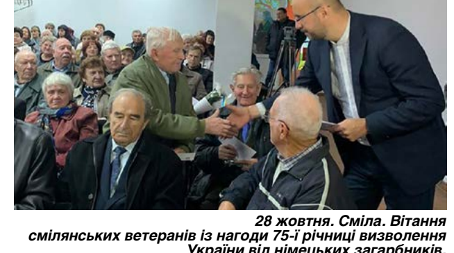
28 жовтня. Сміла. Вітання смілянських ветеранів із нагоди 75-ї річниці визволення України від німецьких загарбників.