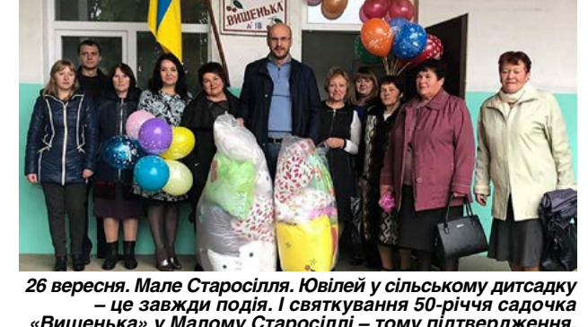
26 вересня. Мале Старосілля. Ювілей у сільському дитсадку – це завжди подія. І святкування 50-річчя садочка «Вишенька» у Малому Старосіллі – тому підтвердження.