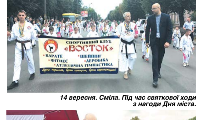
14 вересня. Сміла. Під час святкової ходи з нагоди Дня міста.