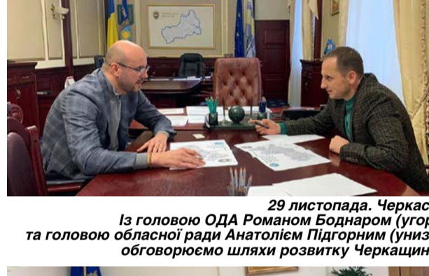
29 листопада. Черкаси. Із головою ОДА Романом Боднаром (угорі) та головою обласної ради Анатолієм Підгорним (унизу) обговорюємо шляхи розвитку Черкащини.