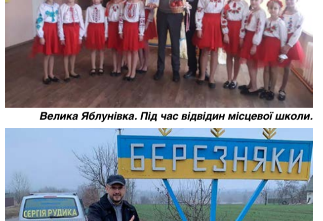
Велика Яблунівка. Під час відвідин місцевої школи.