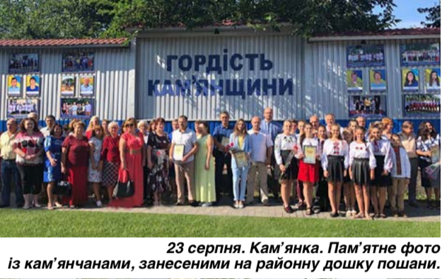
23 серпня. Кам'янка. Пам'ятне фото із кам'ячанами, занесеними на районну дошку пошани.

Регулярні особисті зустрічі з виборцями, систематичні виїзди на місця – це одна з найважливіших складових депутатської роботи. Як тільки з'являється нагода, відразу ж виїжджаю на округ. Так, із початку року побував у 63 населених пунктах свого округу. Із початку цієї каденції – вже у 19. Ще у багатьох селах регулярно бувають мої помічники. Пропоную Вашій увазі короткий фотозвіт (те, що вдалося вмістити на шпальту).