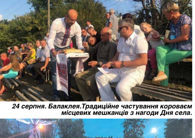
24 серпня. Балаклея. Традиційне чагування короваєм місцевих мешканців з нагоди Дня села.