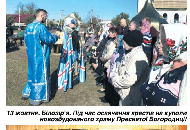
13 жовтня. Білозір'я. Під час освячення хрестів на куполи новозбудованого храму Пресвятої Богородиці!