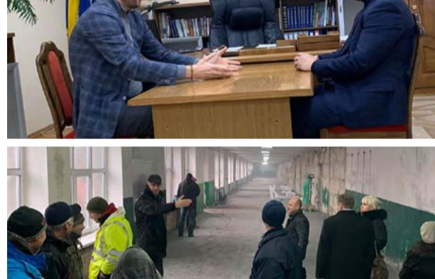
30 листопада. Сміла. Під час інспекції реконструкції легкоатлетичного манежу стадіону «Юність».