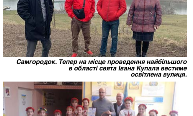
Самгородок. Тепер на місце проведення найбільшого в області свята Івана Купала вестиме освітлена вулиця.