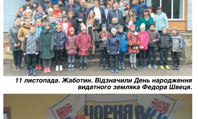
11 листопада. Жаботин. Відзначили День народження видатного земляка Федора Швеця.