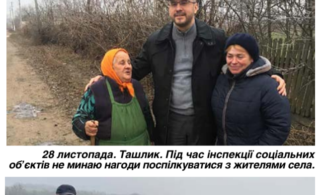
28 листопада. Ташлик. Під час інспекції соціальних об'єктів не минаю нагоди поспілкуватися з жителями села.