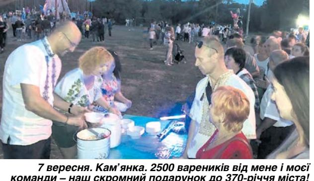
7 вересня. Кам'янка. 2500 вареників від мене і моєї команди – наш скромний подарунок до 370-річчя міста!